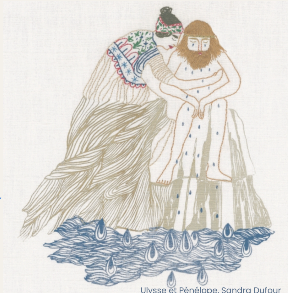
Ulysse et Pénélope, Sandra Dufour

En mêlant et entrecroisant tous les fils de ces histoires, soutenu par une musique omniprésente qui veut autant dire que cacher, une intimité devient une épopée.