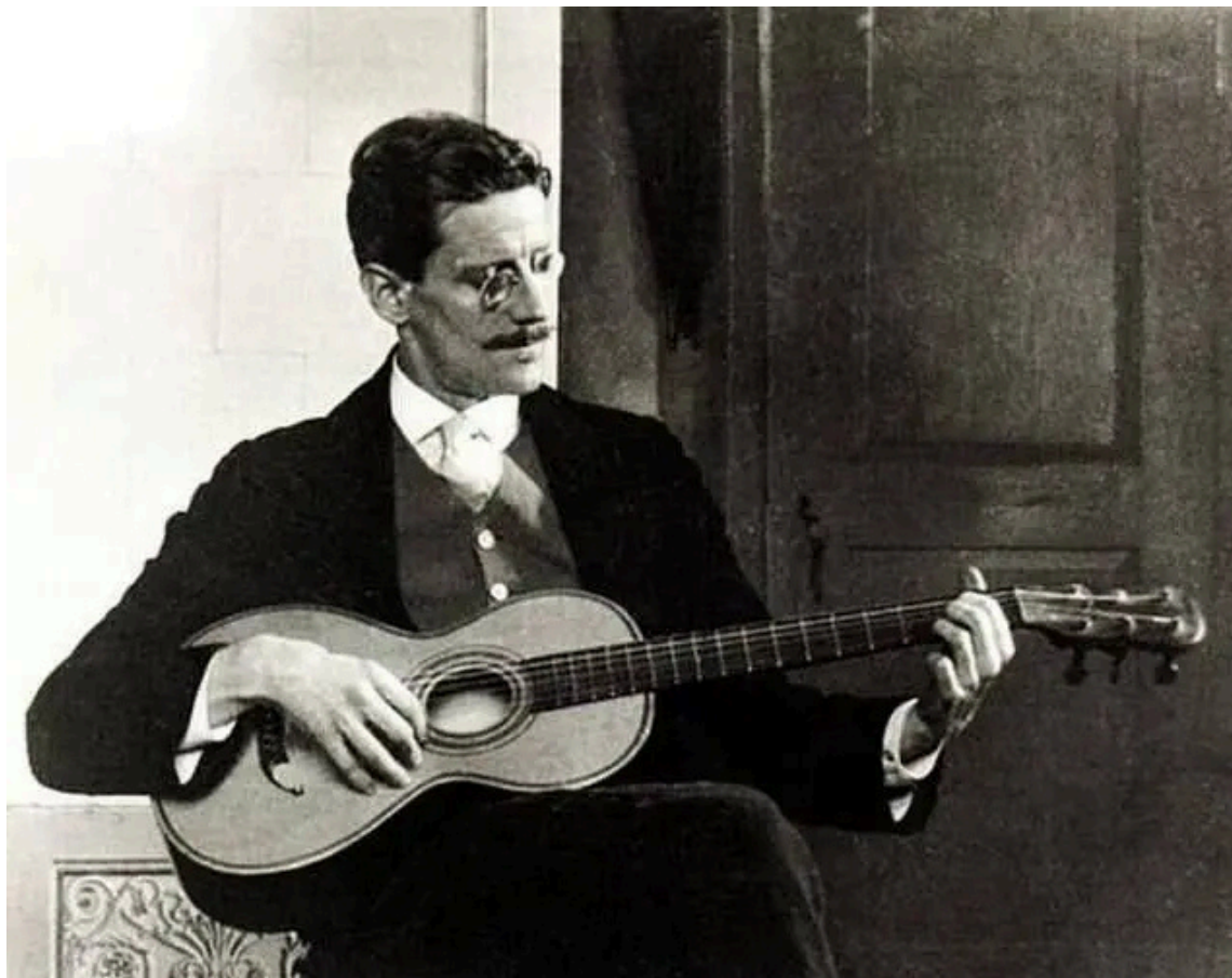
James Joyce à Trieste, 1915