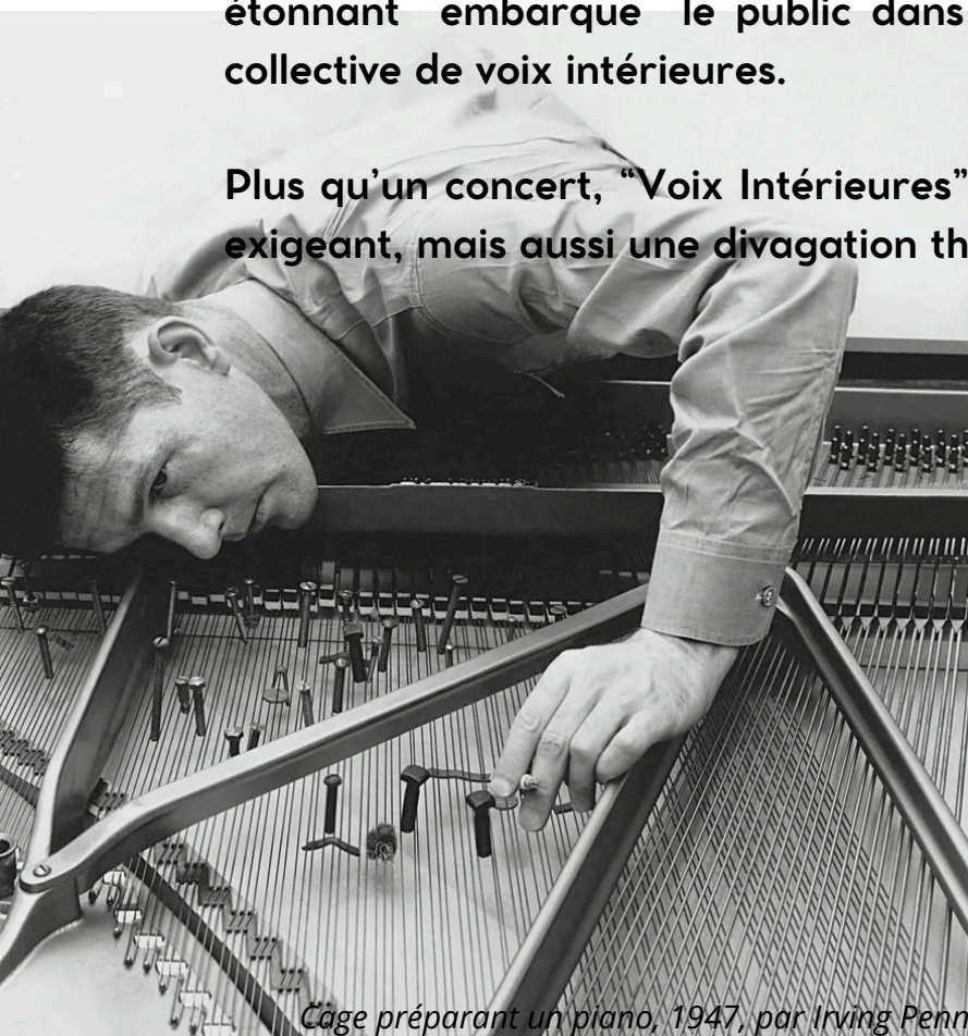
Cage préparant un piano, 1947, par Irving Penn

Plus qu'un concert, "Voix Intérieures" est à la fois un point d'entrée vers un registre musical fantasque, exigeant, mais aussi une divagation théâtrale et ludique sur nos chemins de pensée.